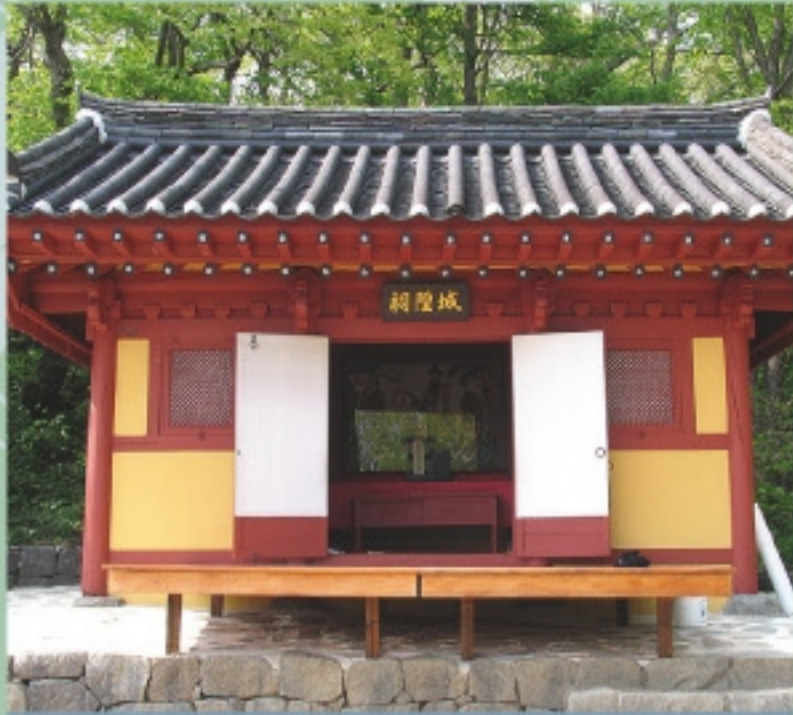
Daegwallyeong Guksa seonghwangsa