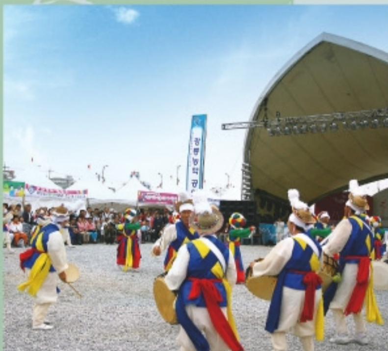
Gangneung Farmer's Music