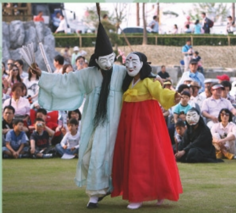
Gangneung Gwanno Mask Drama