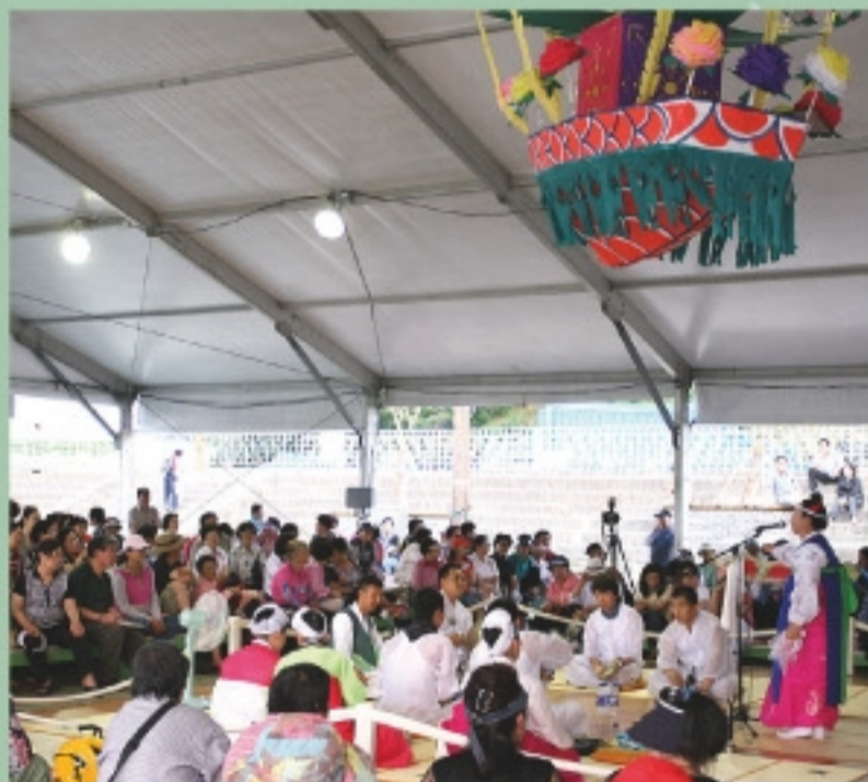
Gangneung Dano Gut(Shamanic Ritual)