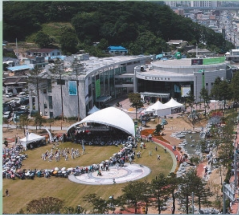
Gangneung Dano Culture Center