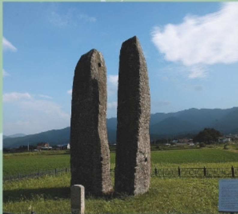
Flagpole Support of Gulsansa